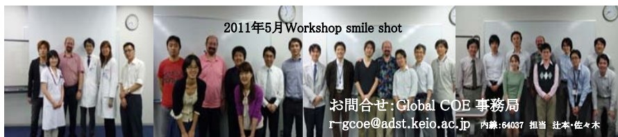
2011年5月Workshop smile shot