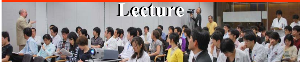
プレゼンテーションスキル向上のためのワークショップ 講義